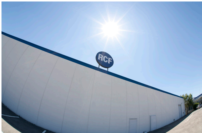
Sede RCF, Reggio Emilia - Italia