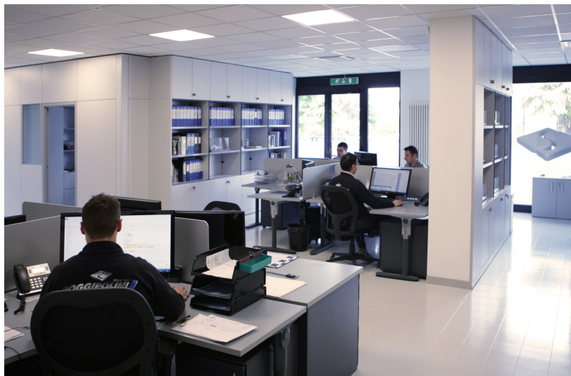
Sede Poggipolini, San Lazzaro di Savena (BO) - Italia